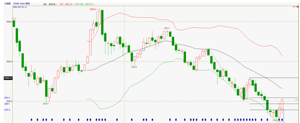
图 1: 股指期货指数周线走势

从 2011 年 4 月以来的下跌来看，每次踩破布林通道下轨和趋势线下轨时，都会酝酿一波反弹。但是由于宏观经济环境、财政货币政策因素的影响，反弹都以夭折告终。这次反弹受消息面的提振，长假期间，外盘走势良好，市场信心较强，开盘后有望跳空高开直接突破布林通道上轨和趋势线压制，节前多单可以继续持有。但上行之后，面临技术回调压力，无仓者看反弹高度逢低入场；如若有回补跳空缺口的迹象，部分多单离场或短空对冲为宜。